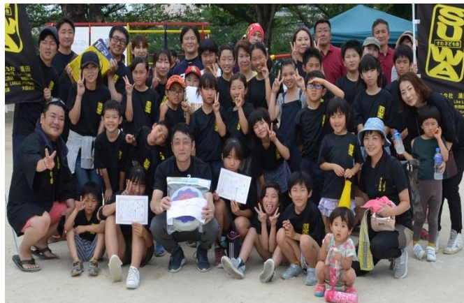
ドッチビー(大人)部 優勝