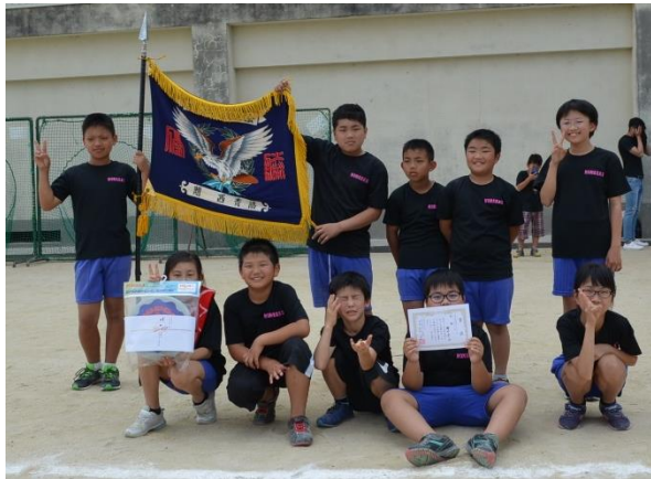
ドッチビー(子ども)部 優勝