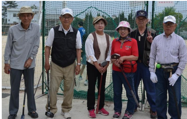
グランドゴルフ部 優勝